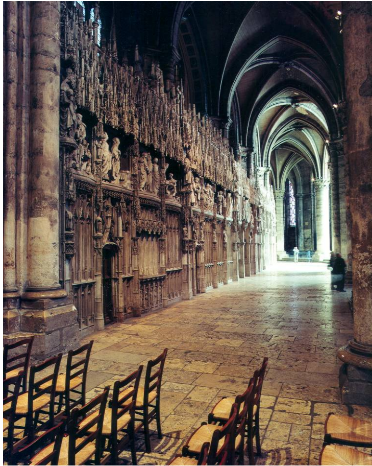
Contrat passé entre Jehan Soulas et le chapitre cathédral de Chartres pour la sculpture et l'édification de quatre scènes devant orner la clôture du chœur de Notre-Dame de Chartres. G 181, fol. 421 recto à 422 recto