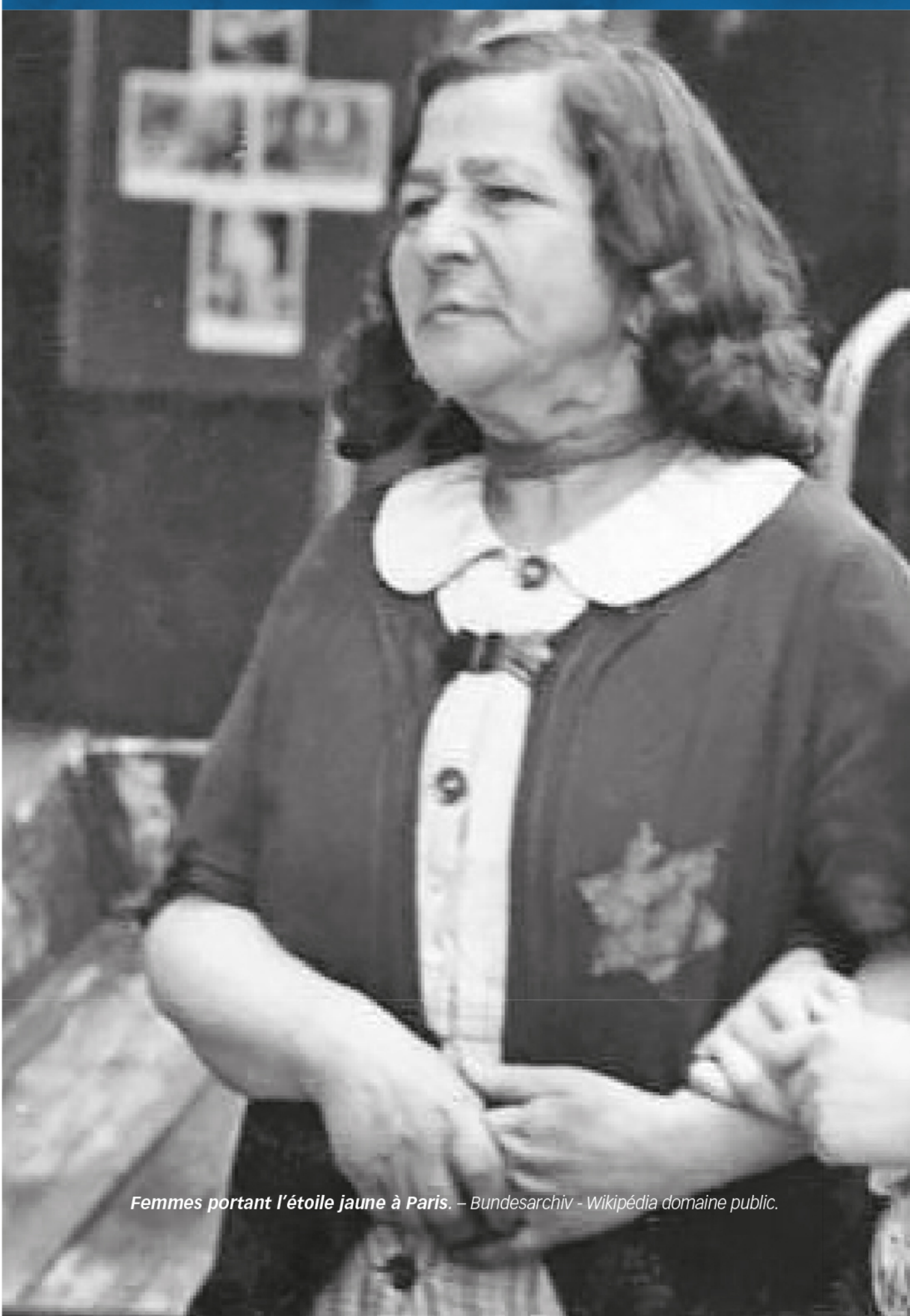
Femmes portant l'étoile jaune à Paris.