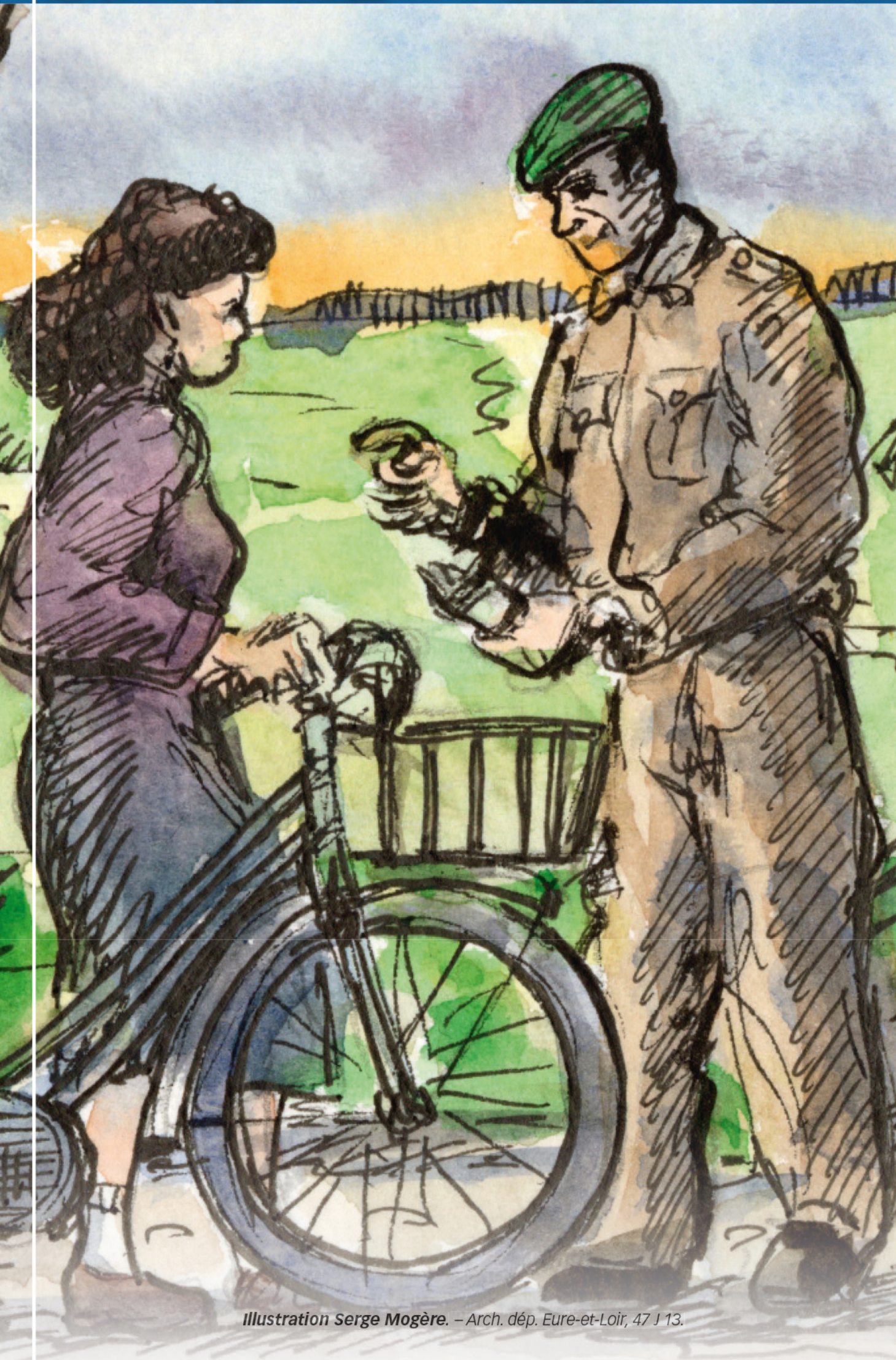
Illustration Serge Mogère. – Arch. dép. Eure-et-Loir, 47 J 13.